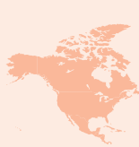
Amérique du Nord